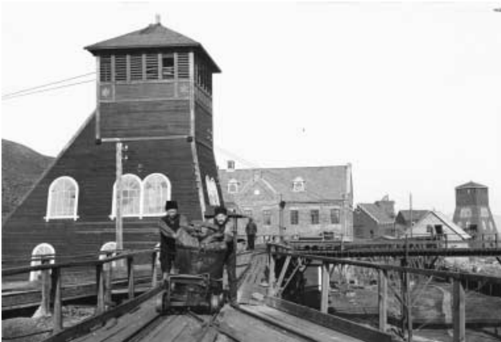
Falu gruva, malmtransport år 1922.

I december 2001 upptog FN-organet Unesco Falun med tillhörande gruva, stad och bergsmanslandskap på sin världsarvslista. Detta innebär att miljön nu utgör en av ca 800 objekt vilka på ett unikt sätt vittnar om jordens och människans historia.