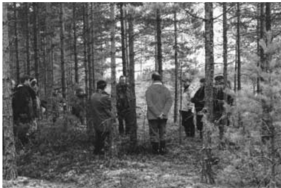
Inventerarna i Mora studerar en älggrop under utbildningen.

Skog & historia är ett projekt som startade 1995 i Värmland. Det har sedan spridits och pågår nu över hela landet. Utformningen och omfattningen varierar dock från län till län. Syftet med projektet är att skapa ett ökat kunskapsunderlag för kulturmiljövården i skogsmarkerna och att fånga upp alla de lämningar som inte finns i fornminnesregistret.