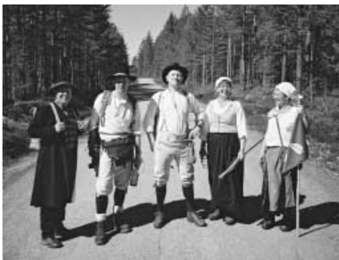
Medlemmar i arbetsgruppen på stovandring.

”En hoper dalfolk med spelmän i täten kommo från Ovansiljan och intog staden...”