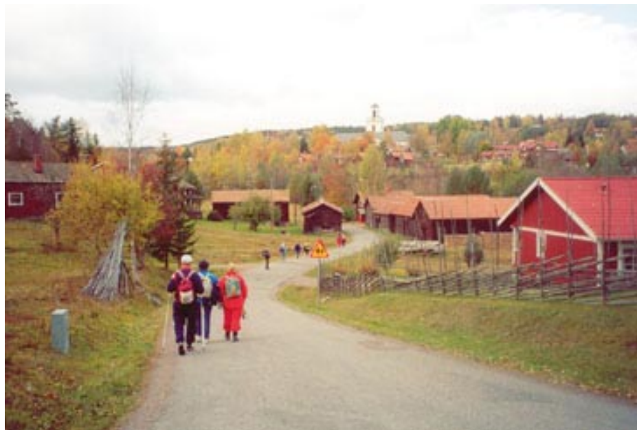
En storslagen vy mot Bjursås kyrka möter vandrarna i Västanbergs by.

När vi närmade oss Bjursås berättade en av våra vandrare att hon varit i kontakt med Församlingshemmet i Bjursås som inbjöd oss på soppa. När vi därför efter knappt fem timmars vandring i maklig takt kom fram till Bjurs, styrdes