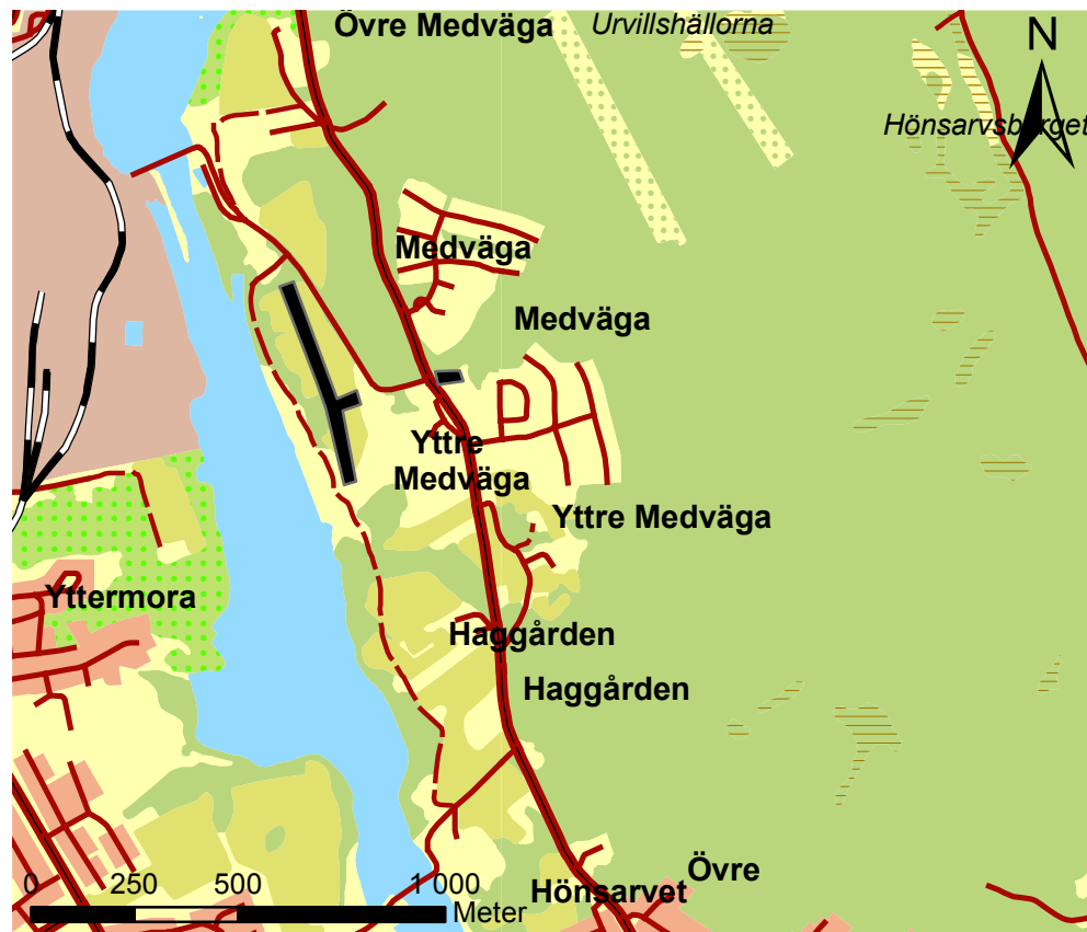
Figur 1. Utdrag ur fastighetskartan med det aktuella området svartmarkerat. Skala 1:20 000.

Huvuddelen av undersökningsområdet låg i en hästhage med långt frodigt gräs. I de södra delarna var topografin svagt kuperad, medan övriga ytan var relativt plan, något sluttande mot väster. Undersökningsområdet låg i slutningen ned mot älven som flöt i väster, med toppen på en höjdrygg cirka 15–20 meter åt öster. Cirka 100–150 meter öster om undersökningsområdet steg marken igen i form av en skogstäkt blockig åsrygg.