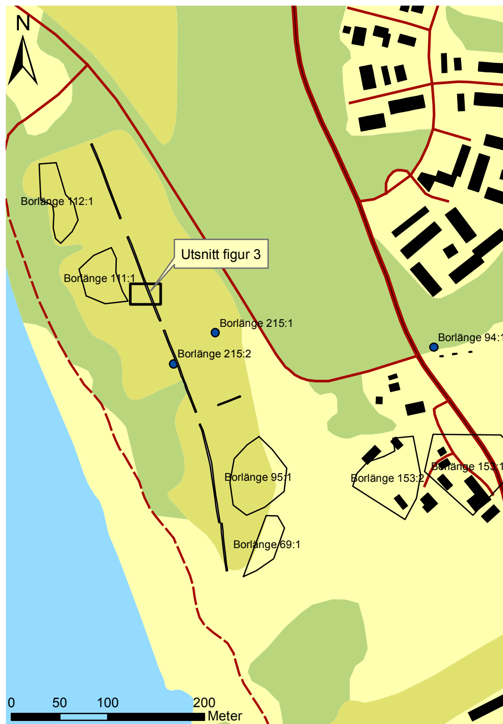
Figur 2. Fastighetskartan över det aktuella området med undersökningsschakten utmärkta. Notera även utsnittet för detaljplanen i figur 3. Skala 1:4000.

Invid undersökningsområdets södra del påträffades en hålmejsel av svart skiffer, 12,0x3,6x2,1 cm stor, raä 95. Mejseln påträffades vid ytplockning av sten och förvaras på Tuna bygdens gammelgård, nr B 1821. I samband med en utredning 1988 noterades en yta på cirka 20 meter i diameter med en mörkare ton på den plats där mejseln tidigare påträffades. Inom denna yta hittades bränd magrad lera, järnföremål samt kvartsbitar och en trolig kvartsskrapa (Sandberg 1988). 1991 påträffades ytterligare fynd i området i form av förslagat tegel, vanlig obestämbart slagg och porslinskärvor av äldre typ samt 3 kvartsavslag, 15–30 mm stora. Detta område ligger på en sandig platta, numera